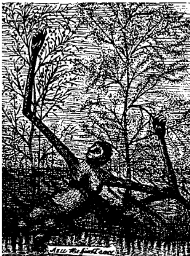
afb. 4 Asu, de eerste mens in de 7e tuin. Zie Jim Dennon in “commentaar”.

21. Dus liet de Heer de mens voor een tijd aan zichzelf over; en de mens had de aarde zo lief, en alles dat zijn gemak diende en zijn vleselijke begeerten, dat hij van zijn hoge staat verviel. En er kwam een grote duisternis over de aarde. En de mens wierp zijn kleren weg en liep naakt, en hij werd dierlijk in zijn begeerten.